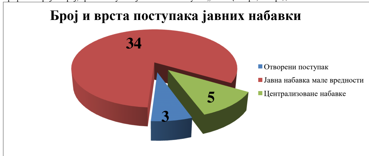
Графикон број 1. Број, врста поступака јавних набавки у ЈП „Сава Центар“, Београд

Предузеће је закључило и 72 уговора у поступцима на које се не примењује Закон о јавним набавкама позивајући се на члан 39. став 2. и члан 7. Закона о јавним набавкама, укупне вредности 40.895.499 динара без ПДВ.